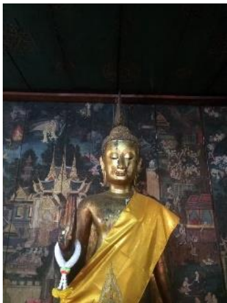
งดงามที่สุดอีกหนึ่งใน “ไผ่ขอน้ำ” ใครเห็นต้องสะดุดตาต้องใจ “มรดกแผ่นดิน ต้องช่วยกัน ดูแลรักษา” มีอาจารย์มหาวิทยาลัยแห่งหนึ่งในพิษณุโลก ชื่อตั้งบอกว่า “พระองค์นี้สมัยรัชกาลที่ ๓-๔” ครั้งแรกที่ได้ยินได้รับฟังว่าสมัยรัชกาลที่ ๓-๔ แต่ก่อนเก่าก็บอกกันมาหลายท่านว่าสมัยอยุธยา