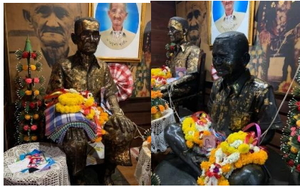
“ไหว้ขอพร ปู่คำ พ่อจัน คุ้มครอง สมปรารถนา ร่ำรวยเงินทอง อยู่เย็นเป็น สุข โรคภัยไม่มี”

บ้านไม้เก่าโชวีฝีมือช่าง บ้านไผ่ขอน้ำ เมืองพิษณุโลก” ลวดลายสวยงาม ผ่านกาลเวลามา เกือบ ๑๐๐ ปี บ้านแม่แก่สาคร พุ่มดั่ง ได้เก็บอนุรักษ์เอาไว้