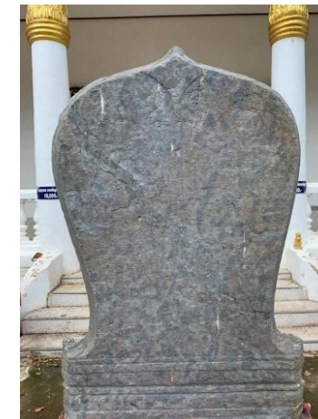
“ใบเสมาหินชนวน เก้าของวัดมะตุม อำเภอพรหมพิราม” สันนิษฐานว่า น่าจะสร้างขึ้นในสมัยอยุธยา เดิมอยู่ที่บริเวณโบราณสถานอุโบสถเก่าของวัดมะตุมเดิม ที่อยู่ห่างจากวัดมะตุมในปัจจุบันประมาณ ๒๐๐ เมตร จากนั้นนำมาไว้บริเวณหน้าซุ้มพระหน้าอุโบสถหลังปัจจุบัน เป็นเวลานาน