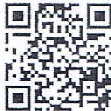
QR Code การรับสมัครออนไลน์

5.1 ผู้สมัครต้องสมัครผ่านระบบออนไลน์ที่เว็บไซต์ https://regpsnu.ac.th/gadmission/ หรือสแกน QR CODE โดยกรอกข้อมูลรายละเอียดให้ถูกต้อง ครบถ้วนและสั่งพิมพ์ (Print) ใบสมัครสอบคัดเลือกและใบแจ้งชำระเงินค่าสมัครสอบคัดเลือก พร้อมติดรูปถ่ายจำนวน 1 รูป ในใบสมัครและลงลายมือชื่อผู้สมัคร