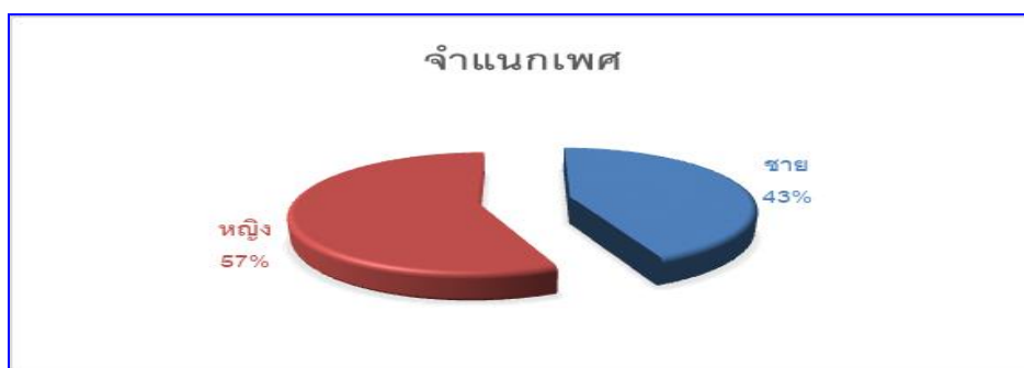
ตาราง ๑ แสดงจำนวนและร้อยละจำแนกตามอายุของผู้ของผู้กรอกแบบสอบถาม

จากตาราง ๑ แสดงให้เห็นว่าผู้เข้าร่วมโครงการส่วนใหญ่เป็นเพศหญิงมากกว่าเพศชาย คือ เพศหญิง มีจำนวน ๑๓ คน คิดเป็นร้อยละ ๕๗ และเพศชาย มีจำนวน ๑๐ คน คิดเป็นร้อยละ ๔๓