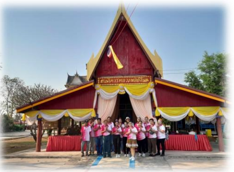
งานส่งเสริมการศึกษา ศาสนาและวัฒนธรรม องค์การบริหารส่วนตำบลพันชาลี