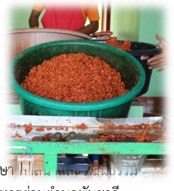
รศ.ศึกษา พิเศษ และคณะทำงาน องค์การบริหารส่วนตำบลพันชาลี