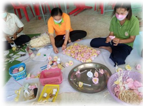
และวัฒนธรรม องค์การบริหารส่วนตำบลพันชาลี