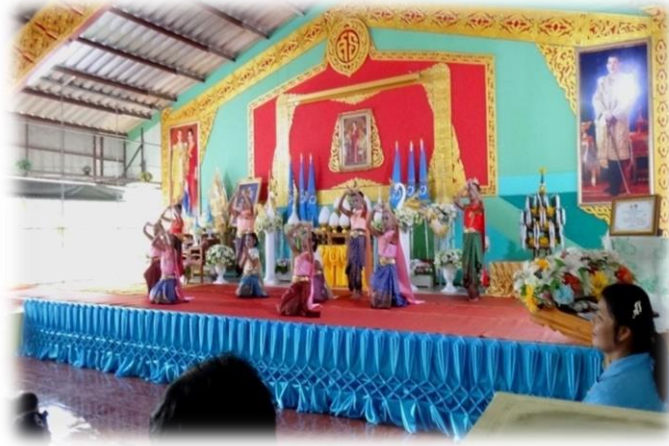
การแสดงรำไทยของเด็กนักเรียนโรงเรียนสามัคคีธรรม