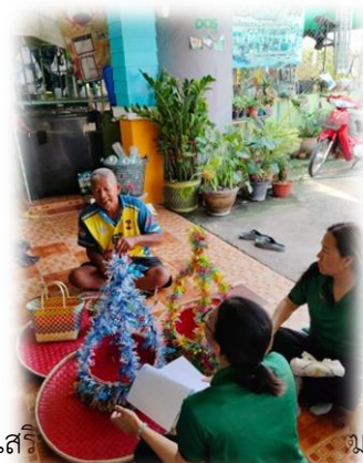
งานส่งเสริมวัฒนธรรม องค์การบริหารส่วนตำบลพันชาลี