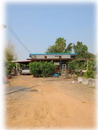
ภาพแสดง พื้นที่ทำครัวเรือนต้นแบบเศรษฐกิจพอเพียง ณ บ้านนายสมปอง ผลสุด ผู้ใหญ่บ้าน ม. ๙

งานส่งเสริมการศึกษา ศาสนาและวัฒนธรรม องค์การบริหารส่วนตำบลพันชาลี