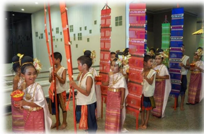
การแสดงฟ้อนรำภาคเหนือของเด็กนักเรียนโรงเรียนสามัคคีธรรม