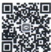
กลุ่มงานส่งเสริมฯ

สำนักงานส่งเสริมการปกครองท้องถิ่นจังหวัด