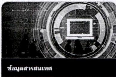
ข้อมูลสารสนเทศ

ชื่อ-สกุล ผู้เข้ารับการฝึกอบรม " ชื่อ-สกุล ผู้ที่จะเข้ารับการฝึกอบรม ชื่อหน่วยงาน " ชื่อองค์กรปกครองส่วนท้องถิ่น (อบจ./เทศบาล/อบต.) ที่ผู้จะเข้ารับการฝึกอบรม สังกัดอยู่ อำเภอ " ชื่ออำเภอที่องค์กรปกครองส่วนท้องถิ่นตั้งอยู่ จังหวัด " ชื่อจังหวัดที่องค์กรปกครองส่วนท้องถิ่นตั้งอยู่ รหัสหน่วยงาน " รหัสองค์กรปกครองส่วนท้องถิ่น ประกอบด้วยตัวเลข ๗ หลัก (ไม่ต้องกรอกเลข ๐ ด้านหน้า) โดยสามารถเปิดดูได้จาก www.dla.go.th