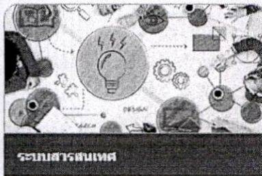
ระบบสารสนเทศ