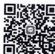
กลุ่มไลน์รุ่นที่ ๑