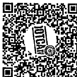
Line Openchat เพื่อการประสานงาน