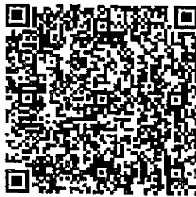
QR Code ๑ ยืนยันการเข้าร่วมอบรม

๔. สามารถติดต่อกับเจ้าหน้าที่โครงการได้ที่ นายชัยรัช มหาท่านโชค โทร. ๐๖ ๓๒๑๐ ๔๗๔๑ หรือเข้าร่วม กลุ่มไลน์ OpenChat เพื่อการประสานงาน