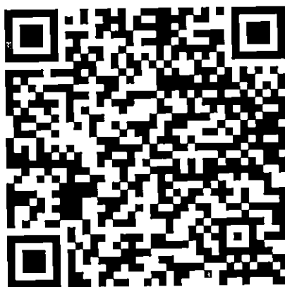
QR Code ดาวน์โหลดสิ่งที่ส่งมาด้วย