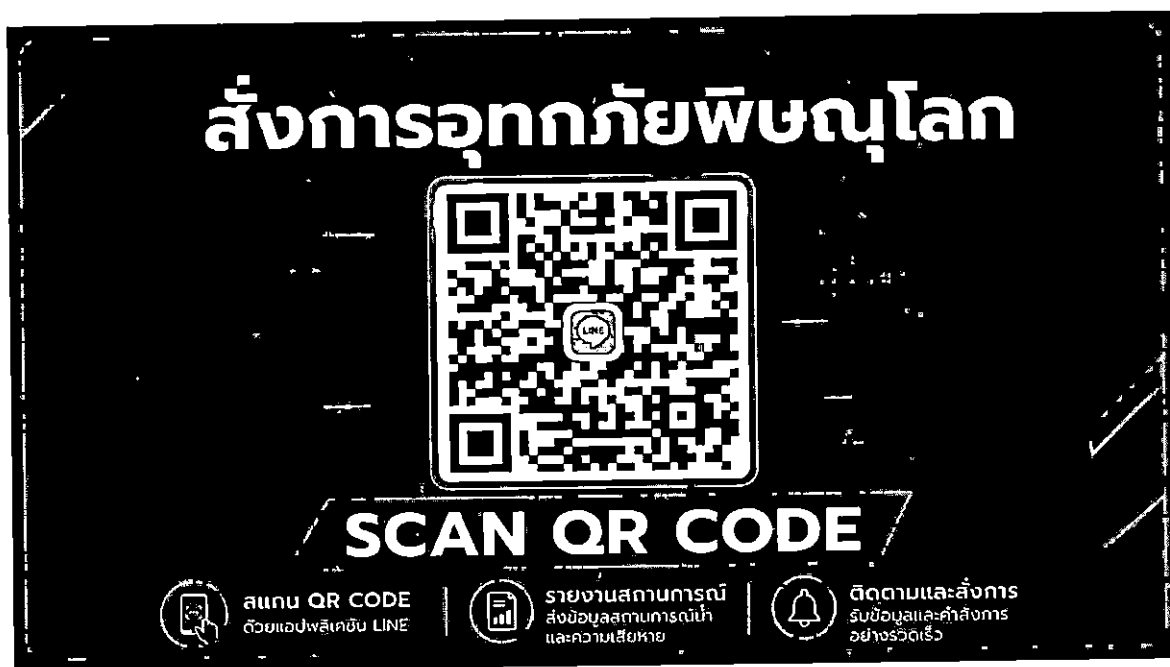
QR Code กลุ่มไลน์ “สั่งการอุทกภัยพิษณุโลก (เฉพาะผู้บริหาร)”