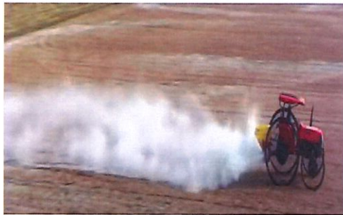
การใส่ปูนโดโลไมต์