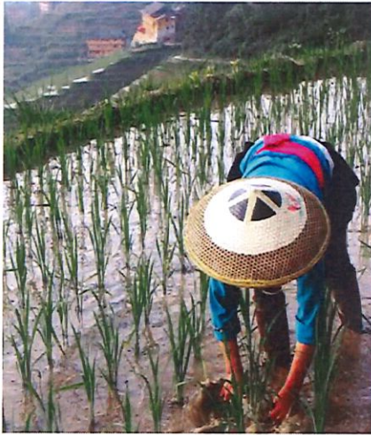
กำลังปักดำในนาข้าว