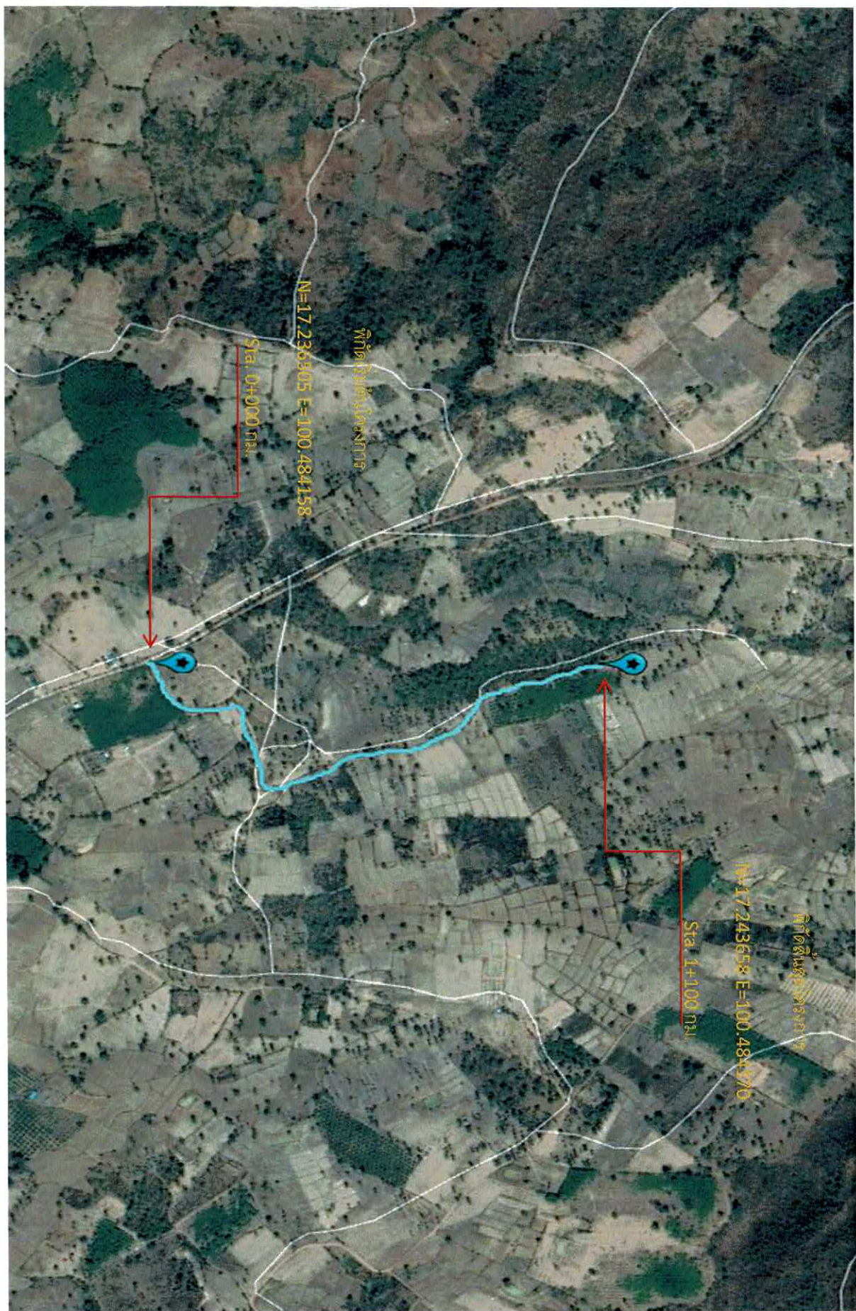
โครงการก่อสร้างถนนดินยกระดี่พร้อมลงฝังจากรดูลิ่ง(สายไร่แม่เปก) หมู่ที่ 2 บ้านหนองขากพยาง